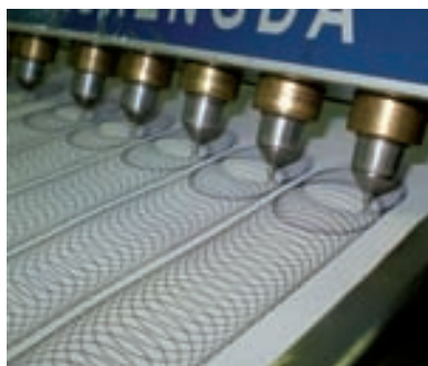
Testeador de bolígrafos