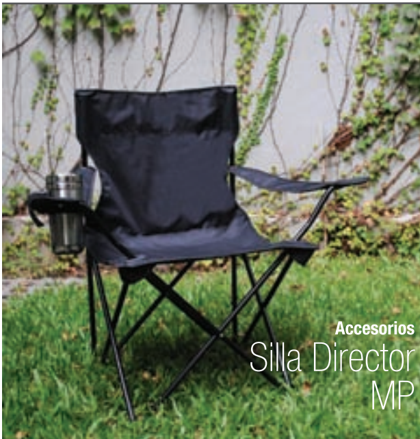
Accesorios Silla Director MP