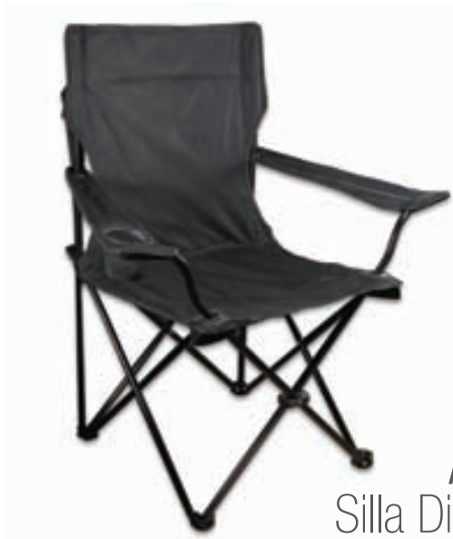
Accesorios Silla Director