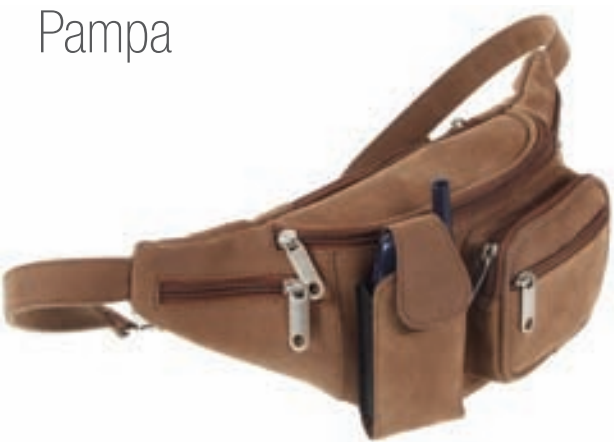
Varios Riñonera Pampa